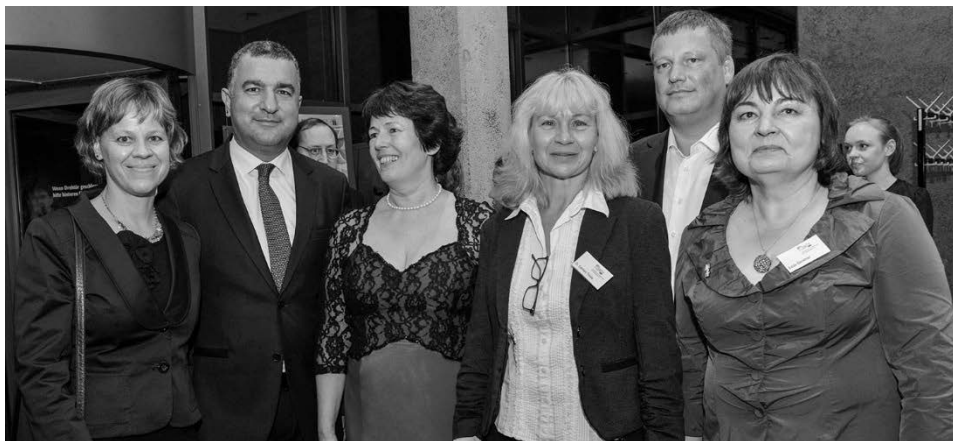
Begrüßung des türkischen Generalkonsuls Ahmet Başar Şen mit Ehefrau.