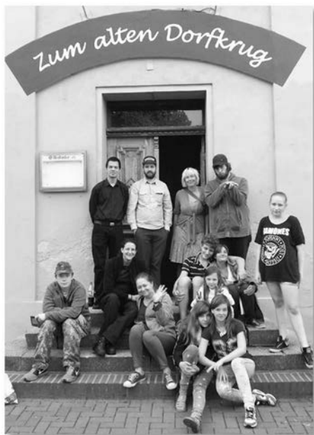
Berliner Pflegekinder mit Freundinnen, Freunden und Filmcrew

Workshop-Projekt in Zusammenarbeit mit der Filmemacherin Sigrun Schnarrenberger (Konzept, Antragstellung und Durchführung) und der Contra Medienwerkstatt realisiert. Weitere Kurzfilm-Workshops sind in Planung.